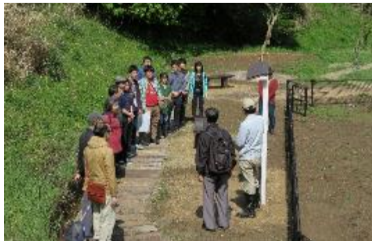
▲新宮町都市整備課からの説明