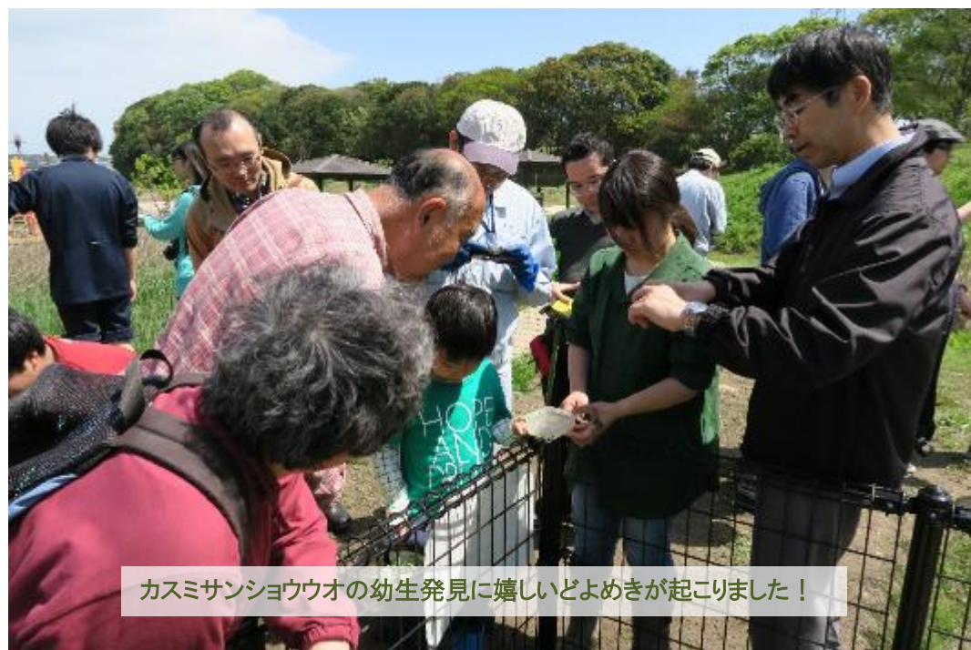
カスミサンショウウオの幼生発見に嬉しいどよめきが起こりました！

平成 28 年 4 月 17 日、本学ビオトープ研究会の学生 9 名が新宮町人丸公園ビオトープで自然観察会を行いました。