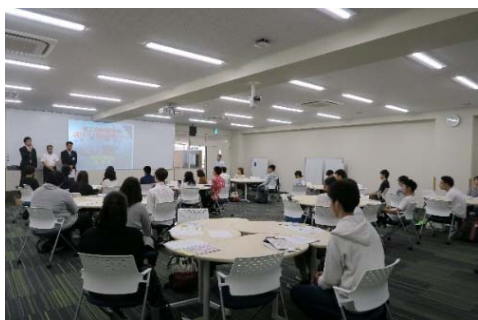
◇プロジェクトのキックオフ