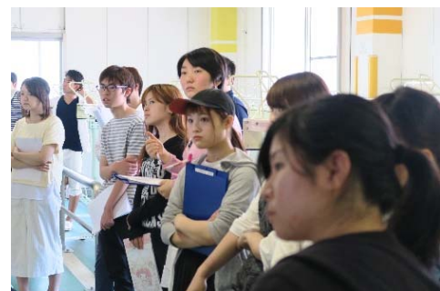
◇2 グループに分かれて周辺環境もチェック