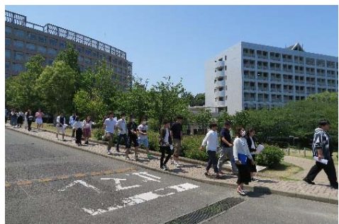
◇晴天に恵まれた現地視察