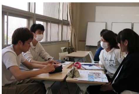
◇自分たちのアイデアをイメージ