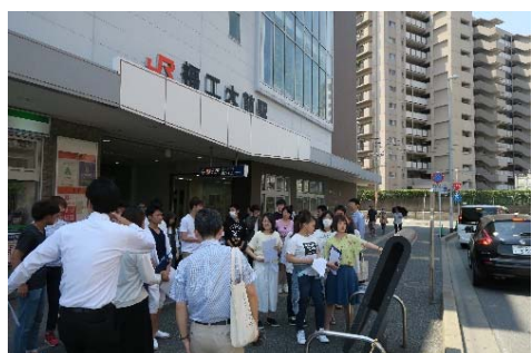
◇JR 福工大駅前で位置を確認