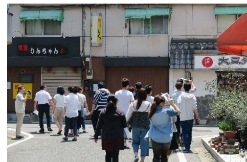
◇2 グループに分かれて周辺環境もチェック