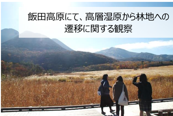
飯田高原にて、高層湿原から林地への遷移に関する観察