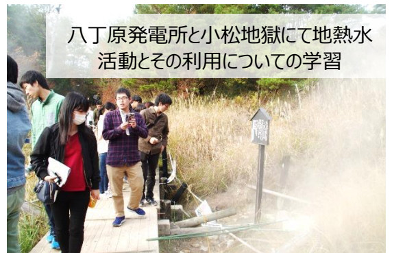
八丁原発電所と小松地獄にて地熱水活動とその利用についての学習

日ごろ何気なく見たことがあっても、じっくり観察したことはないような事象が多かったため、参加学生たちは大変興味深く観察していました。特に今年は天候に恵まれ、秋晴れの中の研修が出来ました。中でも夜間の天体観測では満天の星空を満喫できました。