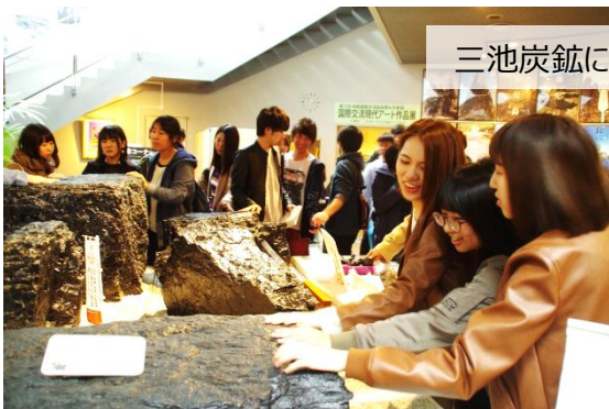
三池炭鉱にて、化石鉱物である石炭と我々の生活との関連について学習

○11月11日(土)、12日(日) FITセミナーハウス(湯布院)を利用した宿泊研修