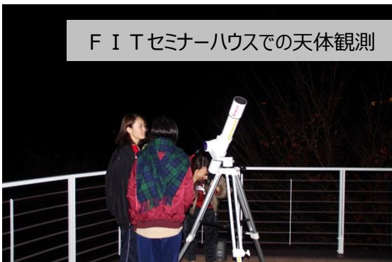
FITセミナーハウスでの天体観測