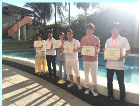
CPILS での修了書授与式