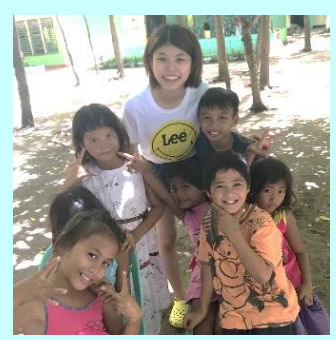
文化体験・アクティビティー

3週間ぶりに日本に帰国した学生達は、本プログラムの参加を通して出会った全ての方々との交流や学修体験を通し、英語がいかに世界の共通語であるかを体験的に学んだことから英語を話す楽しみや喜びを知り、また、自分自身の現状の英語力を認識したことから、さらなる英語学習に意欲を沸かせて新たな目標を語っていました。プログラム期間中、異文化の環境の中で多国籍の人々と共に生活をした経験からも日本の常識が全てではない世界があることを知った学生達は、広い世界感をもって、笑顔と更なるチャレンジ精神に溢れていました。本プログラムの体験から深い学びを得た第1期生の学生達が今後さらに英語学習を継続し、新たな目標に向かって邁進することを楽しみに祈念しています。 (国際戦略室)