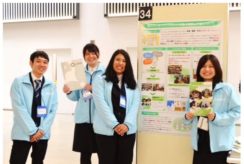
銀賞を受賞したポスター発表のテーマ 「学生FD FIT-joinの取組」