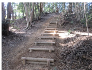
◇里山斜面に階段設置(3月6日撮影)

平成30年度のビオトープ活動は最初に、 4月29日(日)9:30~12:00に第48回自然観察会を開催します。 (添付チラシ参照) テーマは、「春に身近で食べられる野草～味覚で春を感じよう！」 という活動です。是非、親子やグループ、個人などご参加いただき、自然の恵みと学生達との交流も楽しんでください。また、7月7日(土)第49回(夏)、10月13日(土)第50回(秋)、12月8日(土)第51回(冬)に里山・ビオトープ自然観察会を順次、開催します(開催案内は「坂井宏光研究室」HPで公開中)。構内里山の斜面に観察歩道整備として新たに階段設置しました。(写真、階段と里山の裏側の景観)