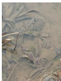
b.ニホンアカガエルの卵塊