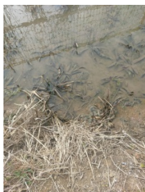
a.人丸公園ビオトープの湿地

2月21日(水)に人丸公園ビオトープで学生3名が自然観察しながら、生物の調査を行いました(写真a~c)。その中で、絶滅危惧種のニホンアカガエルの卵などを見つけました。シマヘビ約60cmも見つけました。急な温暖な気候で早くも冬眠から覚め、活動を始めたようです。造成2年後になり、徐々に動植物が再生・形成されていることが分かりました。