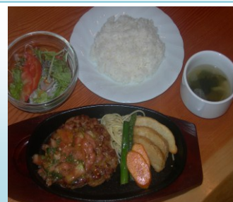
フレッシュトマトのハンバーグ