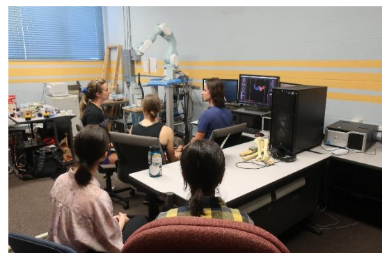
医学系の学生と工学系の学生が研究室でしていたディスカッションを見学させてもらいました