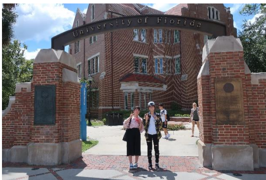
UF 学生の学内の様子を見ることができ、フロリダ大學生生活を 1 週間体験できました

*UF は Gainesville という町にあり、フロリダ州最古・最大規模の大学で、アメリカ合衆国では 3 番目の大きさを誇ります。多岐にわたる分野で学術研究がされている一方で、スポーツでも有名であり、様々な競技で全米チャンピオンになっています。大学内にはプロチーム顔負けの設備が整えられており、約 9 万人を収容することができるフットボールスタジアムも有しています。大学スポーツチームは alligator に由来する "Gators" と呼ばれています。