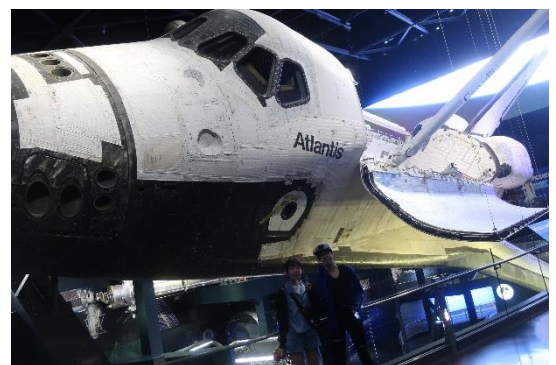
John F. Kennedy Space Center, KSC にも行くことができ貴重な体験をしました