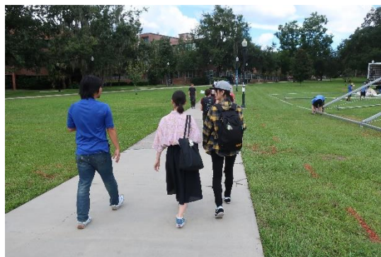
日本から来られている医学系研究者に学内を案内してもらいました