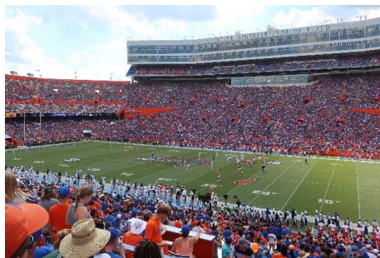
学内のフットボールスタジアムで試合があったので Gators の応援をしました