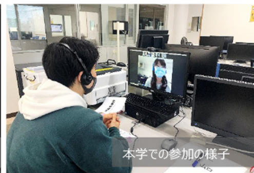
本学での参加の様子

翌週に開かれた「高雄科技大学デー」では、高雄科技大学の学生が準備したキャンパス紹介動画や台湾の文化紹介があり、後半の中国語講座では小グループに分かれ、台湾の学生達より中国語を直接教わりながら交流を深めました。