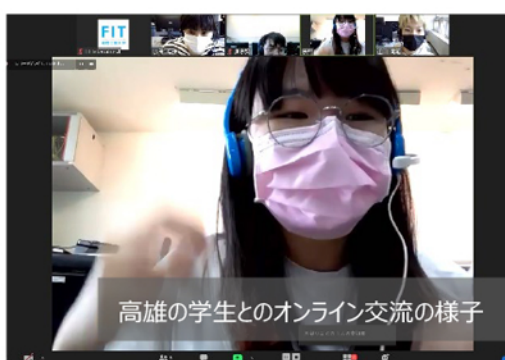
高雄の学生とのオンライン交流の様子