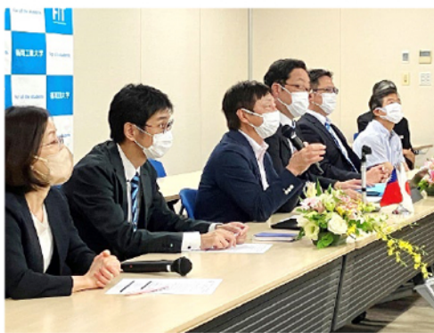
教員による意見交換の様子

【本学の国際交流概要】 https://www.fit.ac.jp/kyoiku/kokusai/