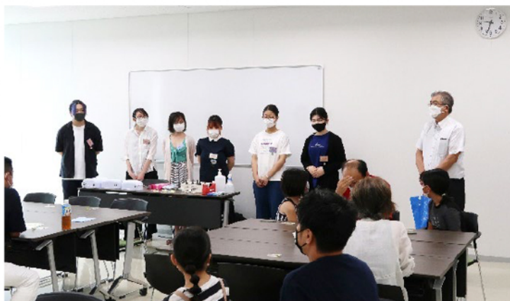
講師を務めた手作りアクセサリプロジェクトの学生とモノづくりセンターの職員

この日は、小学2年生から5年生の子どもたちと、その保護者など40代から70代の大人が参加し、レジンと組みひものキーホルダーを制作しました。レジンキーホルダーは、直径約2cmの円形の土台に小さなかawaiiいパーツを載せて、紫外線で硬化するレジン（樹脂）を流し込み、UVライトを当てて固めて作品が完成します。参加者は、たくさんの種類のパーツの中から自分好みのものを探してピンセットで土台に配置して、世界に一つだけのオリジナルキーホルダーを完成させていました。