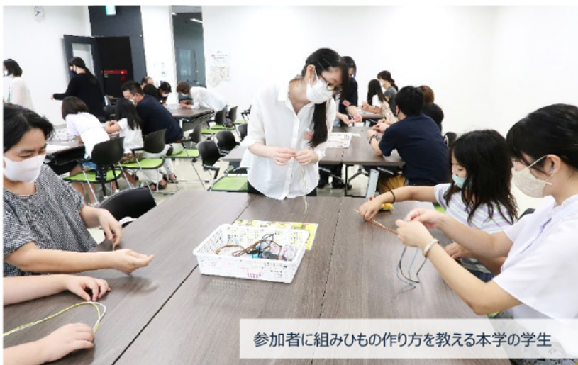
参加者に組みひもの作り方を教える本学の学生

当日は本学の「手作りアクセサリプロジェクト」の学生7人が講師を務めました。手作りアクセサリプロジェクトは、本学モノづくりセンターで活動するプロジェクトの一つで、学科、学年を問わず様々な学生で構成され、授業の無い時間帯でレジンを金属、組みひもなどを使ったキーホルダーやアクセサリを制作し、地域からの要望があれば出前講義で制作方法を教えるなどの活動を行っています。