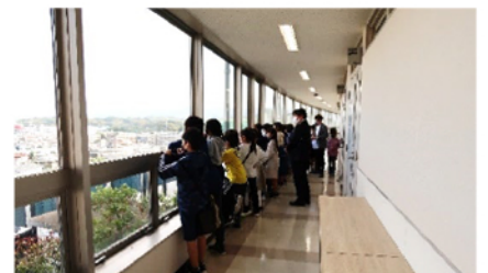
大学の 6 階から小学生たちが住む新宮町を一望しました