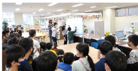
国際連携室で英語のネイティブ職員と交流 白板を使ったクイズに挑戦