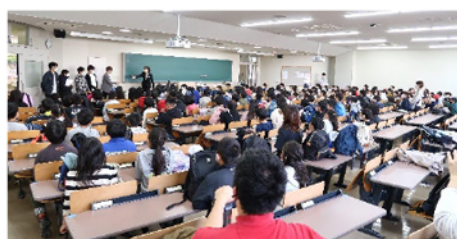
大学の講義室 145 名の小学生が全員入る広さに驚いた様子でした