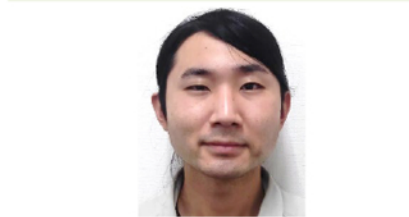
高島様 2021年知能機械工学専攻修了