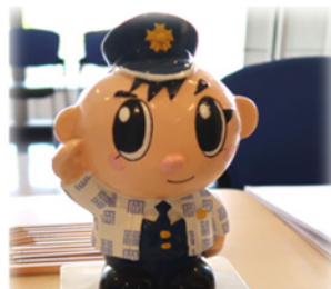
参加学生を迎える 福岡県警察のシンボル・マスコット「ふっけい君」