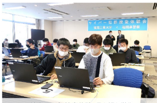
協力しながら捜査体験に取り組む学生

今回の体験会は本協定の一環として企画され、参加学生48名がサイバーセキュリティの技術を競いながら学ぶCTF（Capture The Flag：情報技術を駆使し隠された答えを見つける）のほか、ロールプレイング形式でのサイバー犯罪捜査の体験に取り組みました。