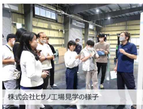
株式会社ヒサノ工場見学の様子