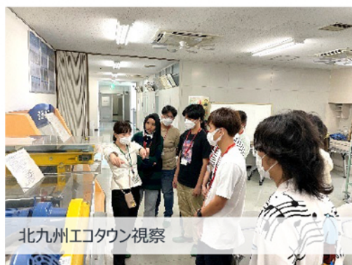
北九州エコタウン視察