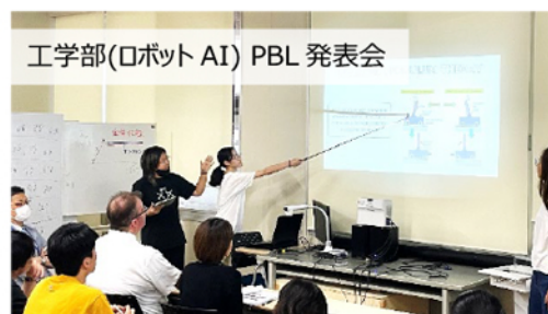
工学部(ロボット AI) PBL 発表会