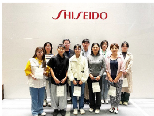
資生堂久留米工場見学