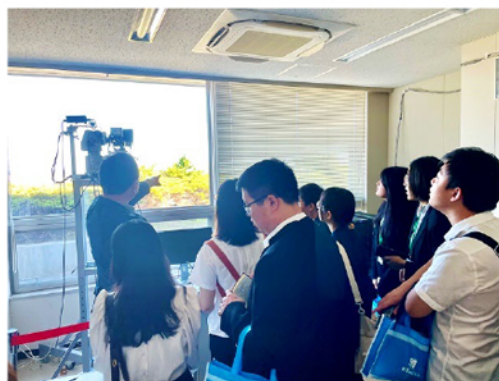
盧教授による地震津波発生と計測 講義