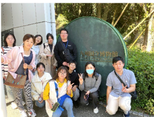
九州国立博物館見学