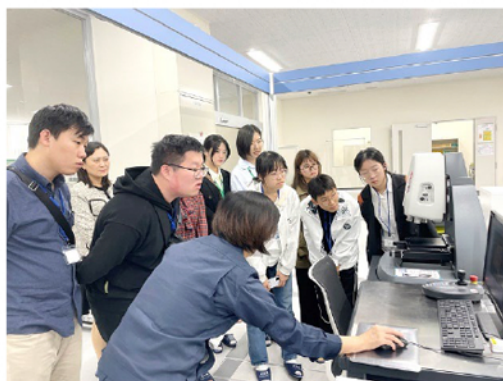
総合研究機構エレクトロニクス研究所見学

招へいた学生からは、「ことわざにあるように、百聞は一見に如かずです。今回のさくらサイエンスプログラムを通じて、日本の先進的な技術だけでなく、日本の文化についてもより理解出来るようになりました。福岡へ留学したいです。福岡工業大学に留学したいです。」などの感想が聞かれました。