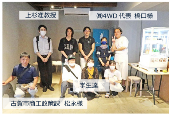
7/22 古賀市土曜夜市視察。商店街イベントの賑わいを肌で感じました。