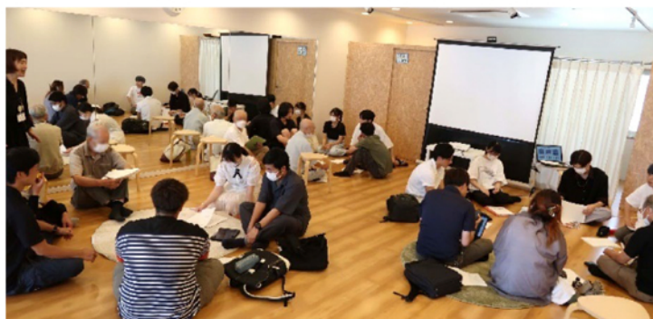
7/24 地域の方との第1回交流会