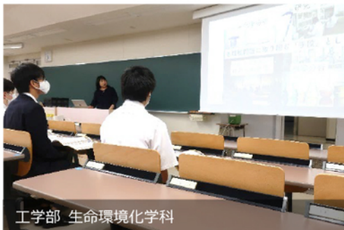
工学部 生命環境化学科