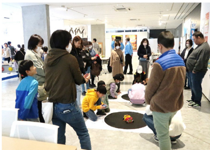
ミニ相撲ロボットの操作体験