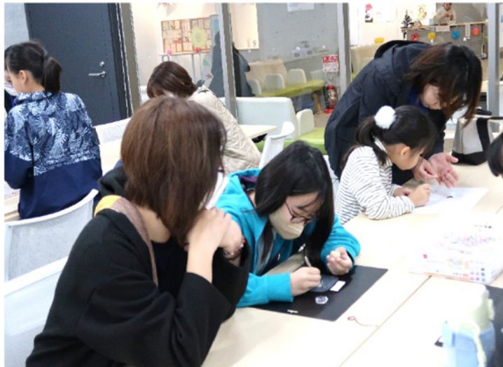
レジンキーホルダーの制作