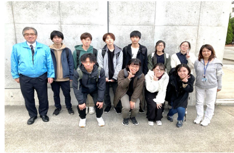
モノづくりセンタープロジェクトチームの皆さんと東区役所職員の方