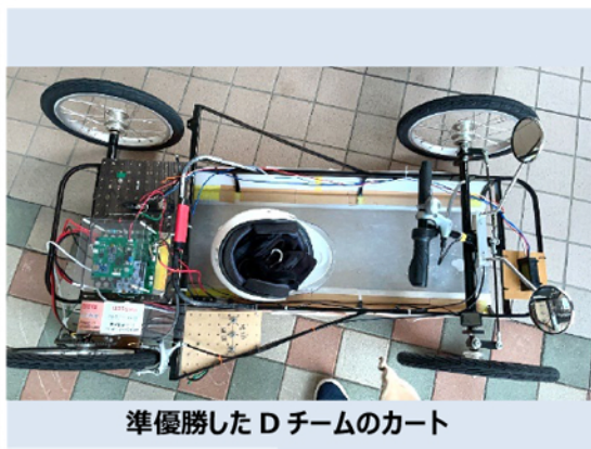
準優勝した D チームのカート