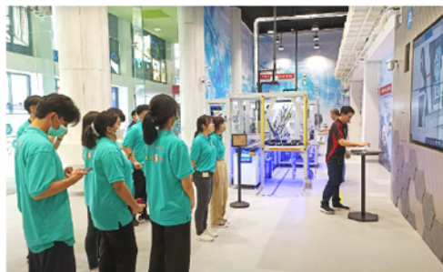
TPのAdvanced Manufacturing Centre