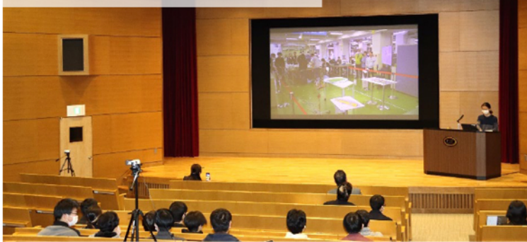
3月13日(水) リーダー研修報告会の様子

競技フィールド上に設置された4カ所のテーブル(台)上へ紙飛行機を何らかの方法で載せて、得点を競う