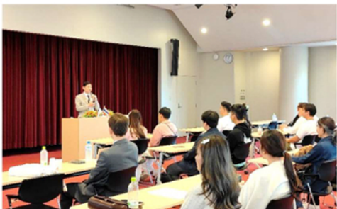
在福岡タイ王国総領事館ゴーソン総領事講話