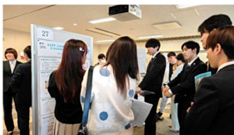
学生ポスターセッションの様子