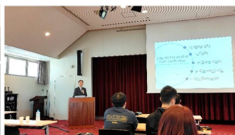
赤木教授特別講演