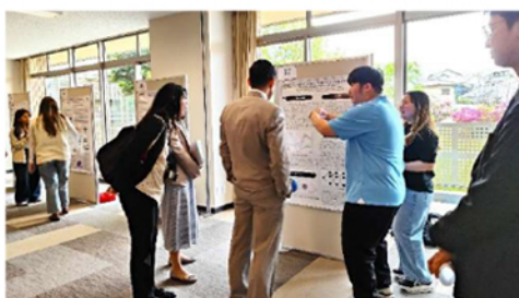
学生ポスターセッションの様子