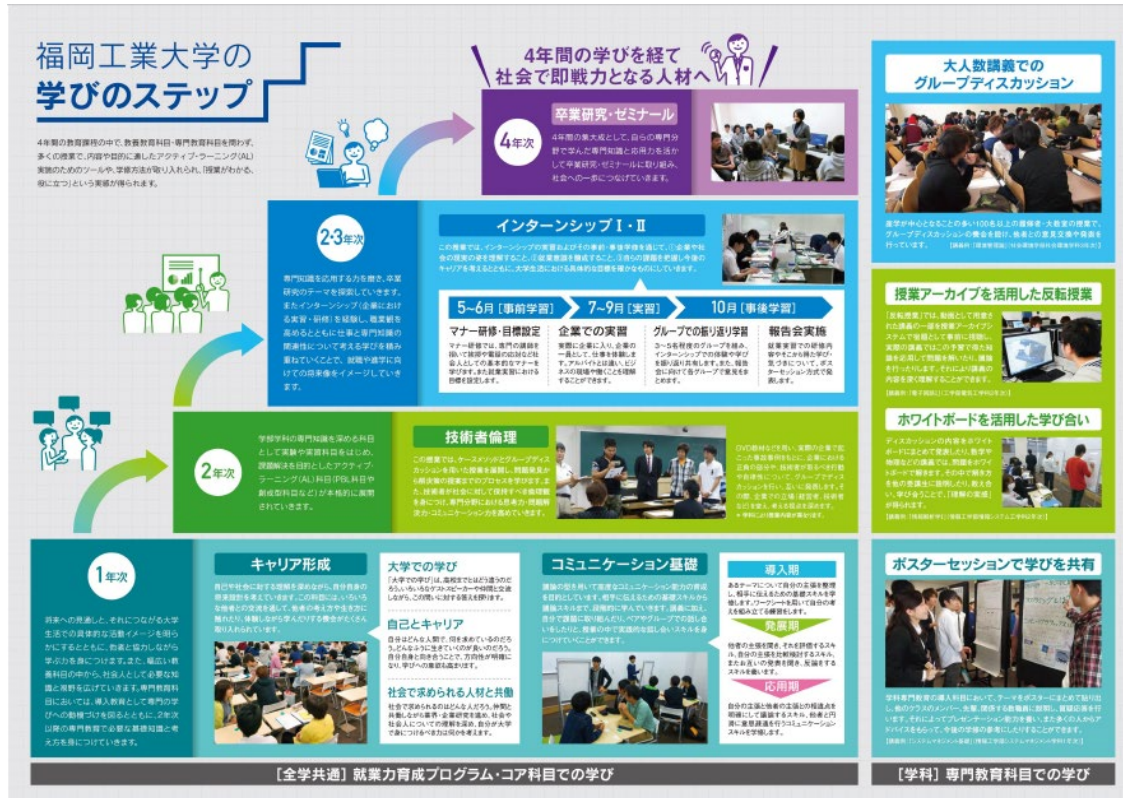
図4-2 就業力育成プログラム

本学では、実践型人材にとって必要な「就業力」の構成要素である、「志向する力」、「共働する力」、「解決する力」および「実践する力」の4つの力を身に付けるため、図4-2で示したように、就業力育成プログラムを設けている