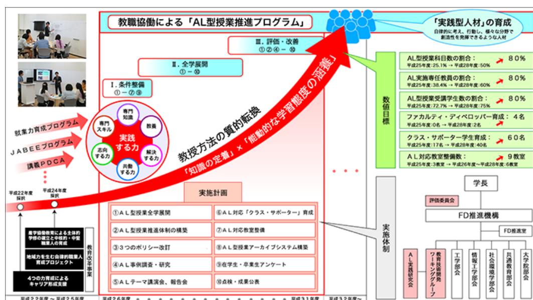
図4-3 AL型授業推進プログラム

学生の主体的参加を促す授業形態、授業内容及び授業方法として、AL型授業の全学展開を行っている。本学では、2014(平成26)年度大学教育再生加速プログラムの採択を受け、図4-3で示すとおり、本学の人材育成目標「自律的に考え、行動し、様々な分野で創造性を発揮できるような人材（実践型人材）の育成」を達成するため、本学の教育改革のフレームに「教授方法の質的転換」を加え、その具体的方策としてAL型授業の全学的展開を推進、学生の「知識定着」と「能動的な学習態度の涵養」の実現を図っている。6年間の事業期間を通じて、ALを導入した授業科目数や実施教員の割合を80%にまで引き上げることを目標としているが、2017(平成29)年度にはAL型授業数・受講学生数・実施教員すべての割合が目標値である80%を達成、全学展開の具体的かつ実質的進展が図られた（資料4-7）。